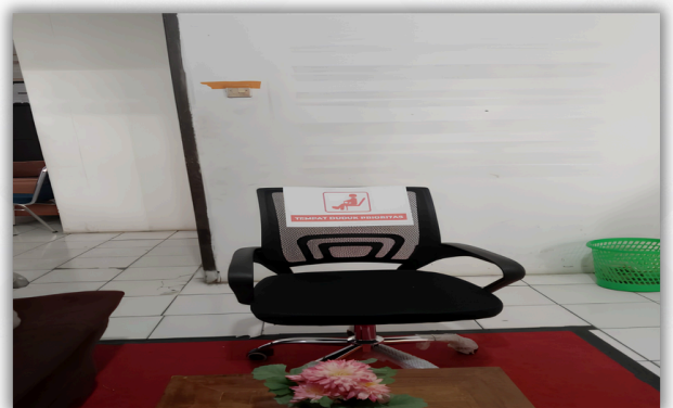
Tempat Duduk Disabilitas