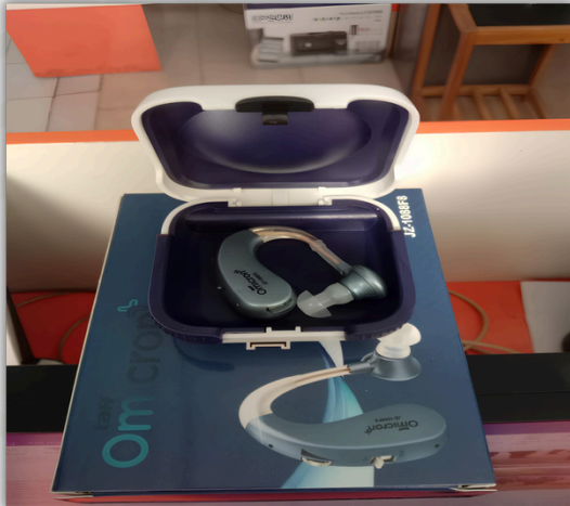
Alat Bantu Tuna Rungu