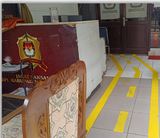
Jalan Khusus Disabilitas