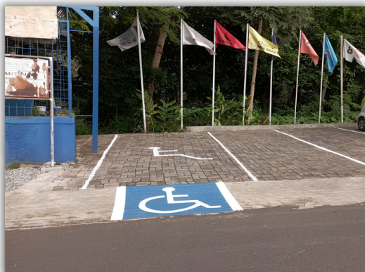
Parkir Khusus Disabilitas